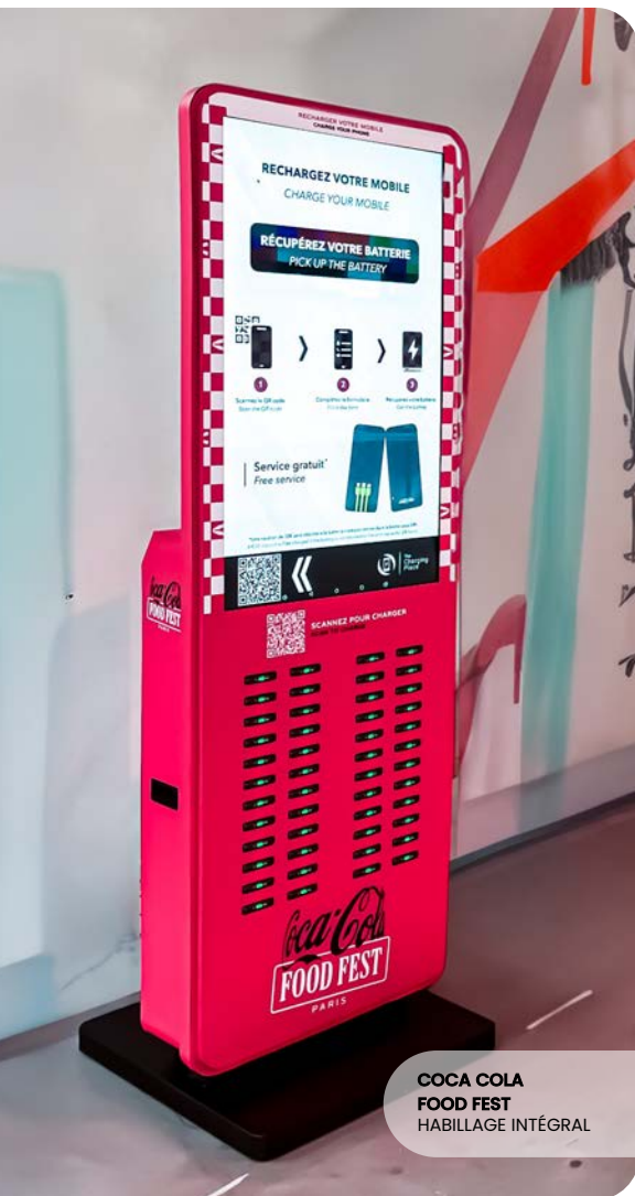
COCA COLA FOOD FEST HABILLAGE INTÉGRAL