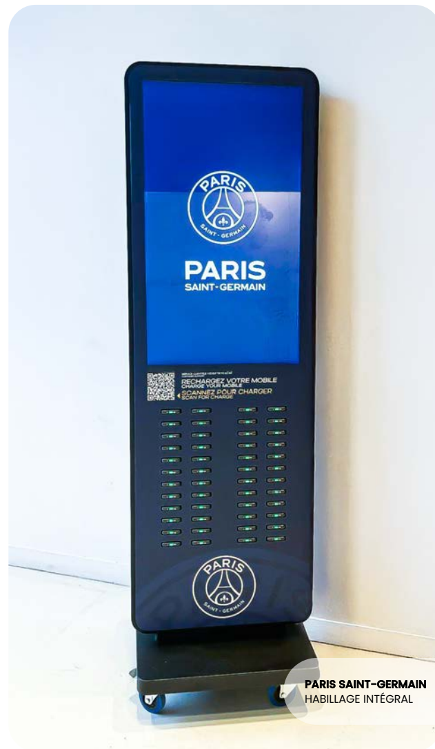
PARIS SAINT-GERMAIN HABILLAGE INTÉGRAL