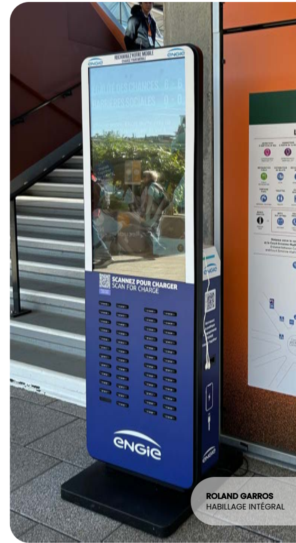
ROLAND GARROS HABILLAGE INTÉGRAL