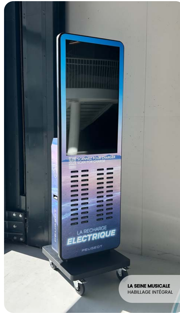
LA SEINE MUSICALE HABILLAGE INTÉGRAL