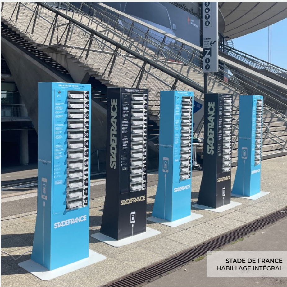
STADE DE FRANCE HABILLAGE INTÉGRAL