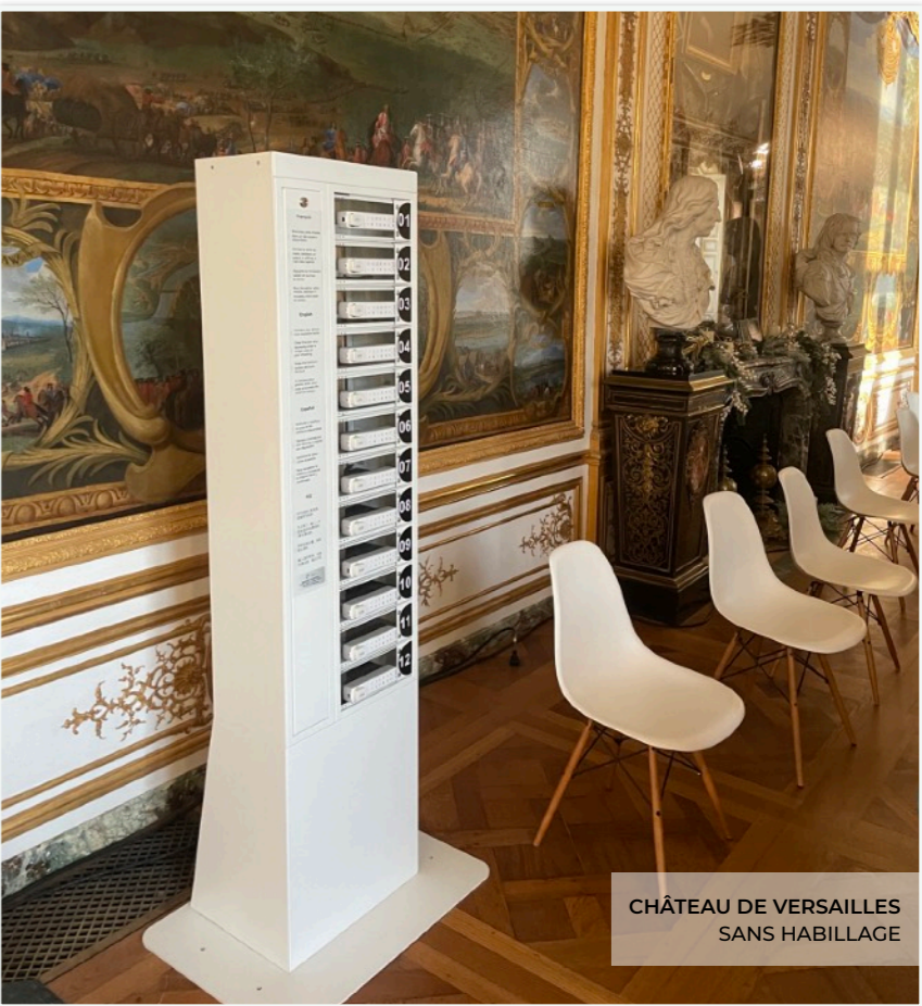
CHÂTEAU DE VERSAILLES SANS HABILLAGE