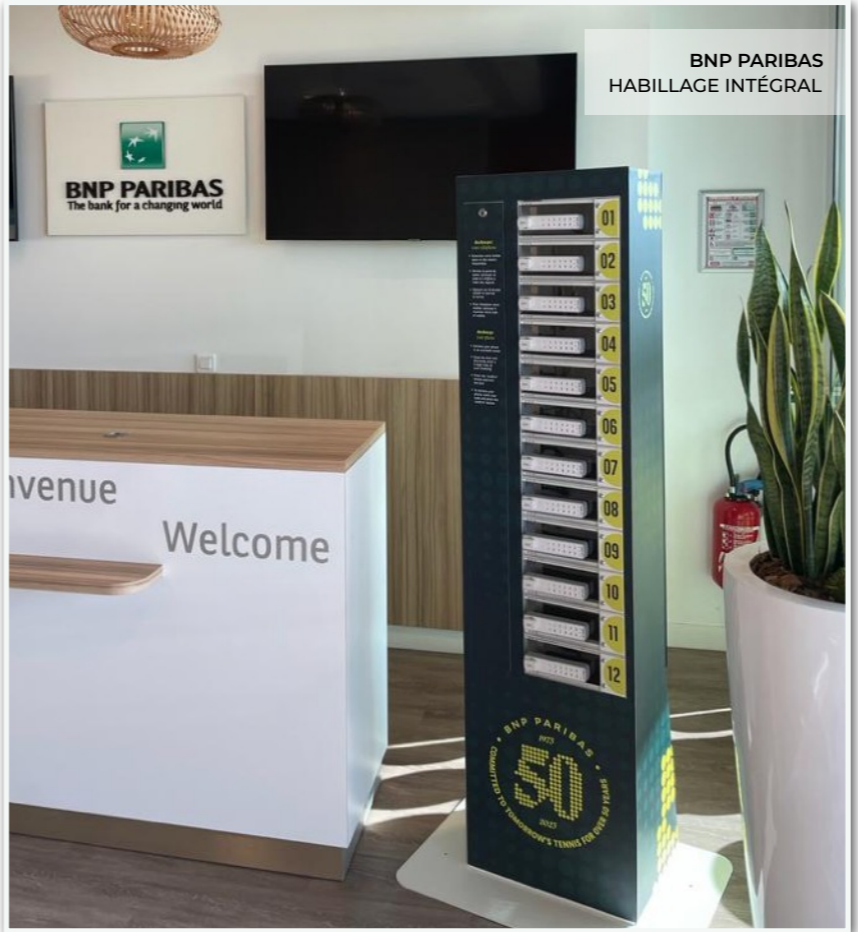
BNP PARIBAS HABILLAGE INTÉGRAL