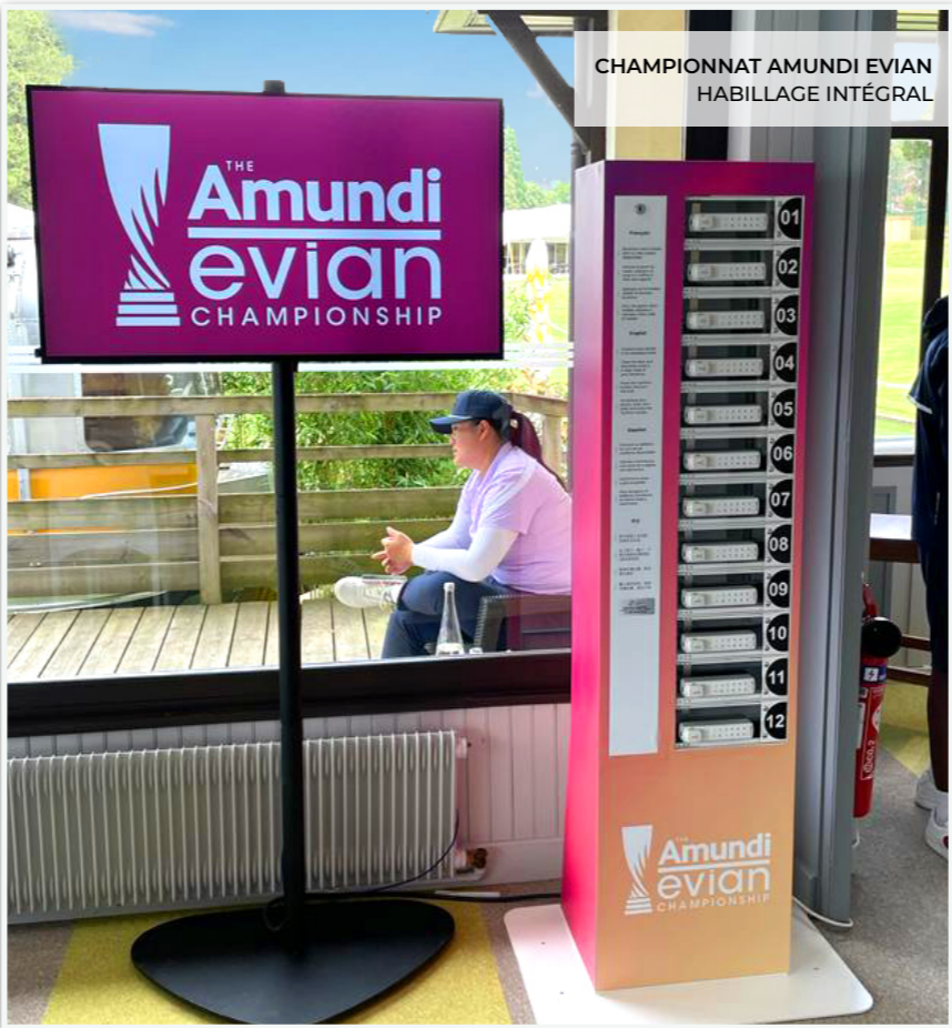
CHAMPIONNAT AMUNDI EVIAN HABILLAGE INTÉGRAL