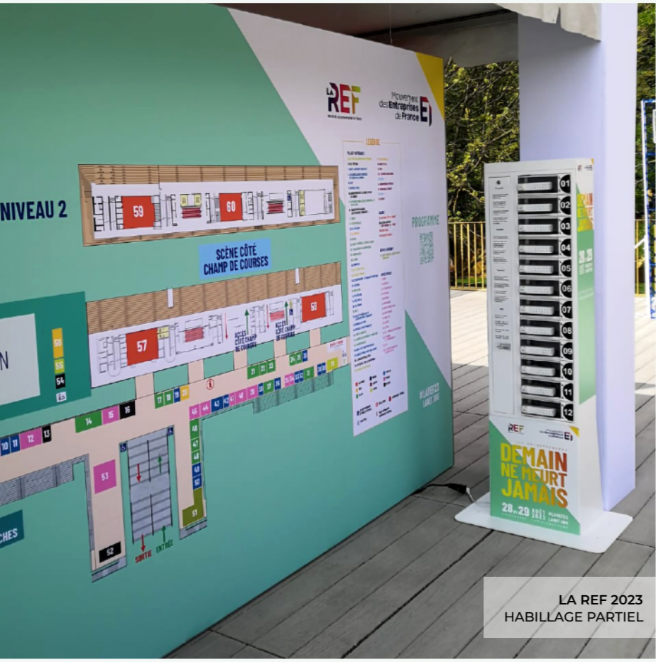
LA REF 2023 HABILLAGE PARTIEL