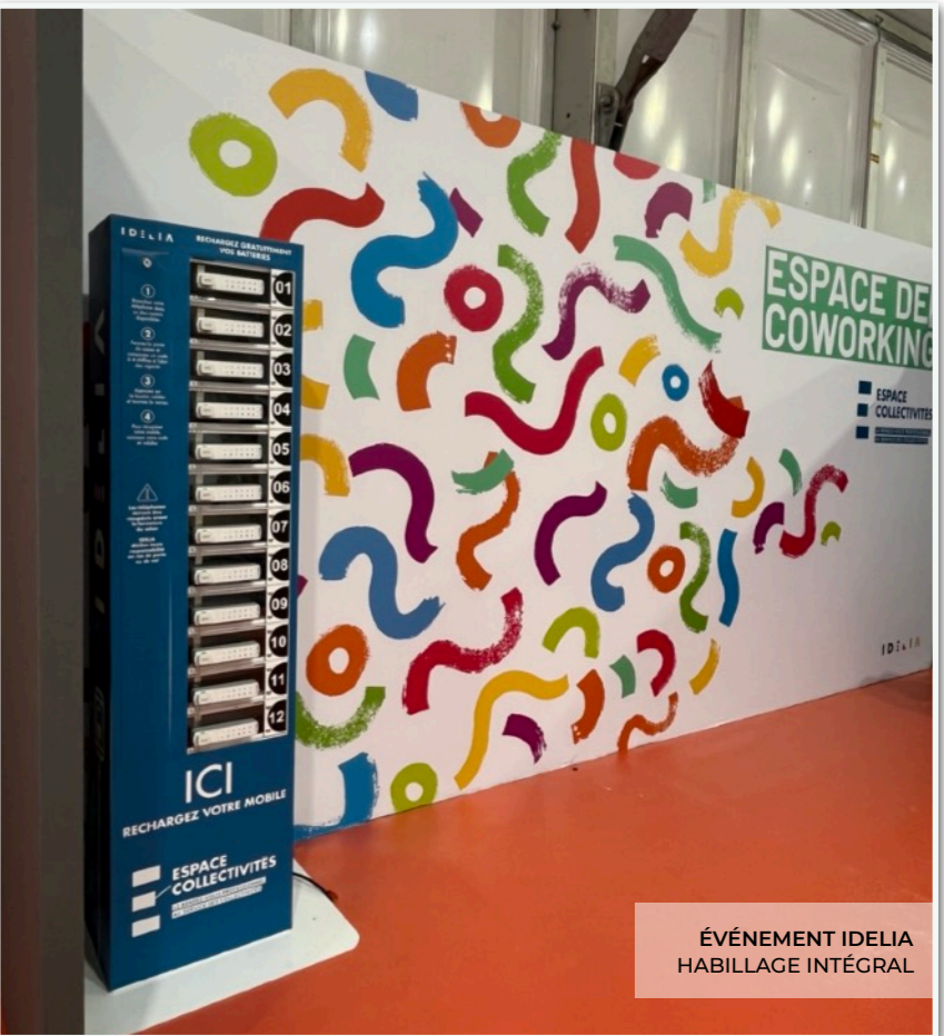
ÉVÈNEMENT IDELIA HABILLAGE INTÉGRAL